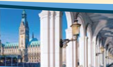
Rathaus in Hamburg