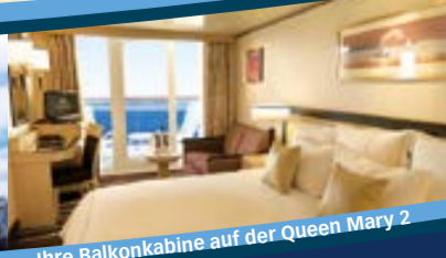
Ihre Balkonkabine auf der Queen Mary 2