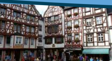
Bummeln in Bernkastel Kues