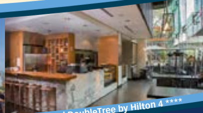
Lobby Hotel DoubleTree by Hilton 4****